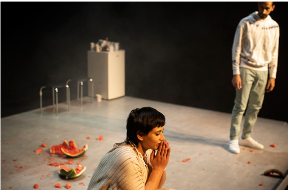
SCÈNEFOTO'S (C) Koen Broos