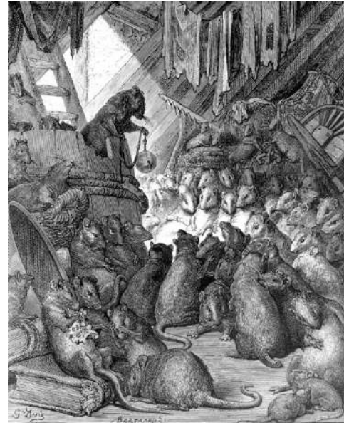
The council of rats- Gustave Dore

Wat volgt zijn 15 verzen uit het Crombrugs handschrift in Middelnederlandse taal.